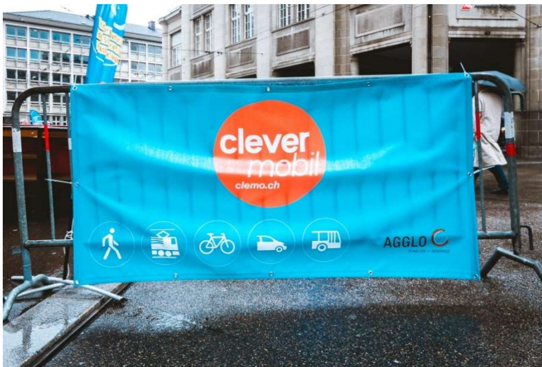
Blache an Condicta-Gitter (Anlass Eröffnung Bahnhofplatz St.Gallen)