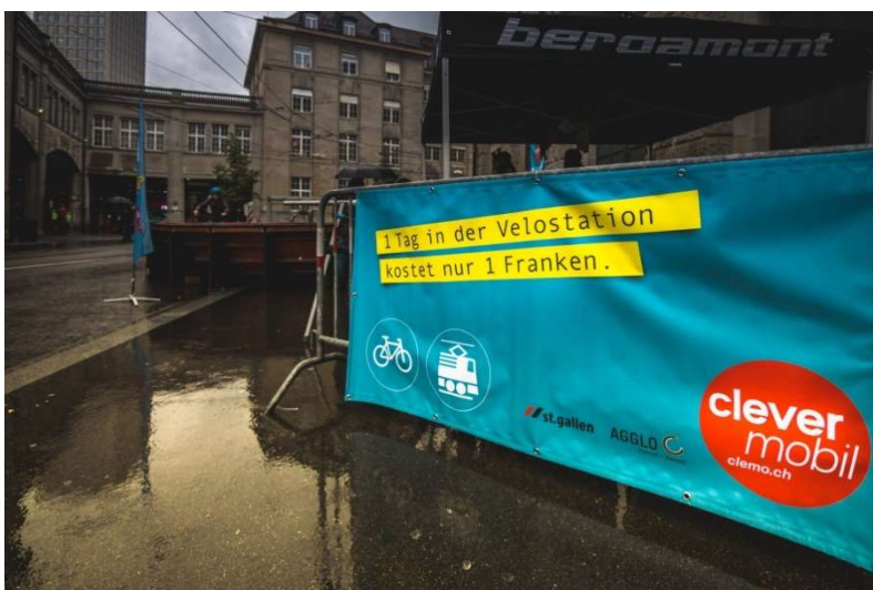
Blache an Condicta-Gitter (Anlass Eröffnung Bahnhofplatz St.Gallen)