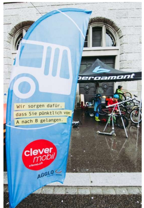
Eröffnungsfest Bahnhofplatz St.Gallen