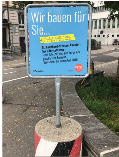
Baustellenplakat «Problemzone ade...» oder «Wir bauen für Sie...» Verschiedene Textvarianten möglich