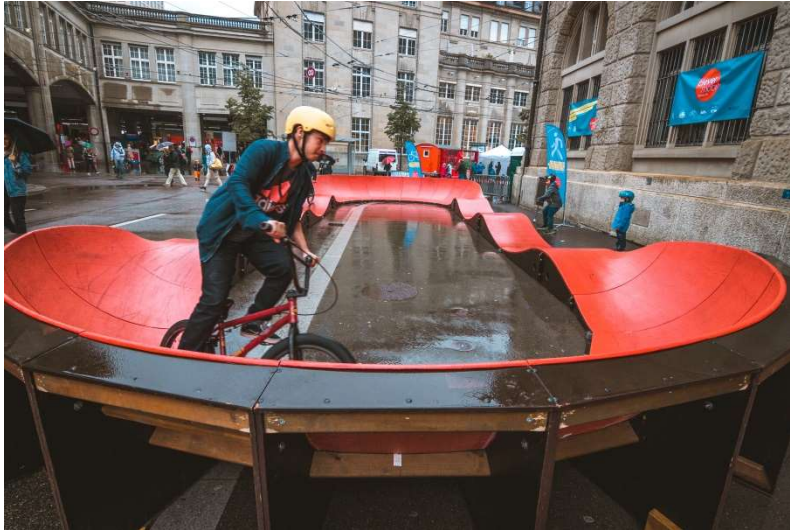
Pumptrack als Attraktion für Eröffnungen, angemietet (Anlass Eröffnung Bahnhofplatz St.Gallen)