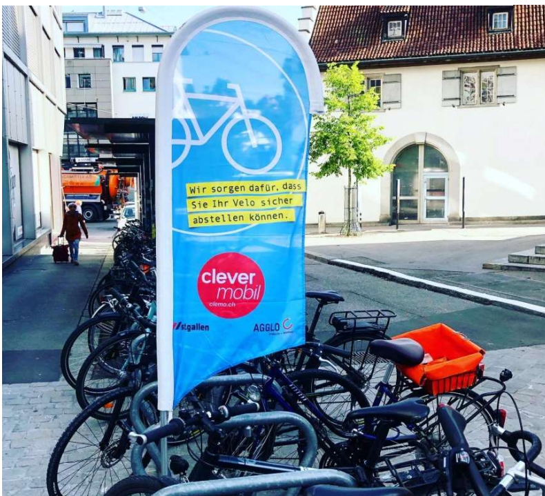
Sichtbarmachen von mobilen Veloständern